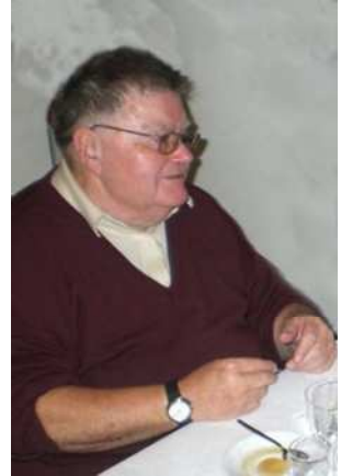
Artiste et comédien

— Ouiii !! C'est vrai !! Il était excellent comédien et avait toujours un rôle important aux soirées de gym. Ces soirées annuelles étaient pour moi un immense événement et j'adorais la façon dont les productions étaient mises en valeur par ces pièces de théâtre.