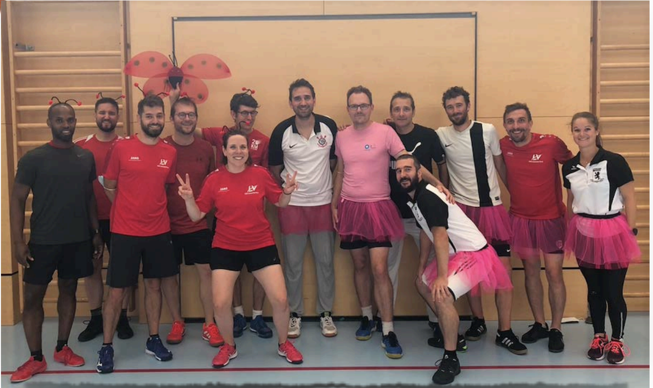
Tournoi intersection 2021: l'équipe freesport

Société de la Fédération Suisse de Gymnastique