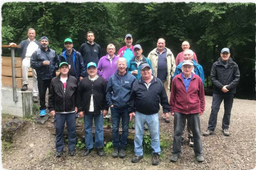
La gym Homme et Senior en balade

Société de la Fédération Suisse de Gymnastique