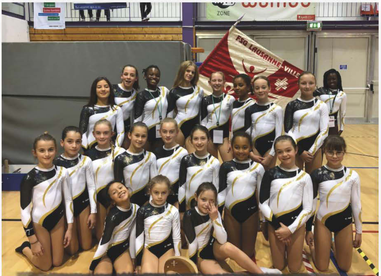
Les Agrès, championnes suisses 2019, Bellinzona.

Société de la Fédération Suisse de Gymnastique