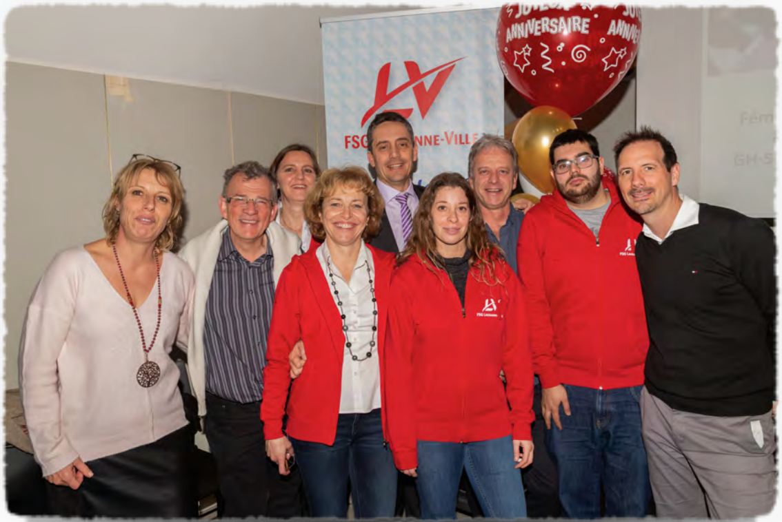
75 ème Assemblée Générale de Lausanne-Ville

Société de la Fédération Suisse de Gymnastique