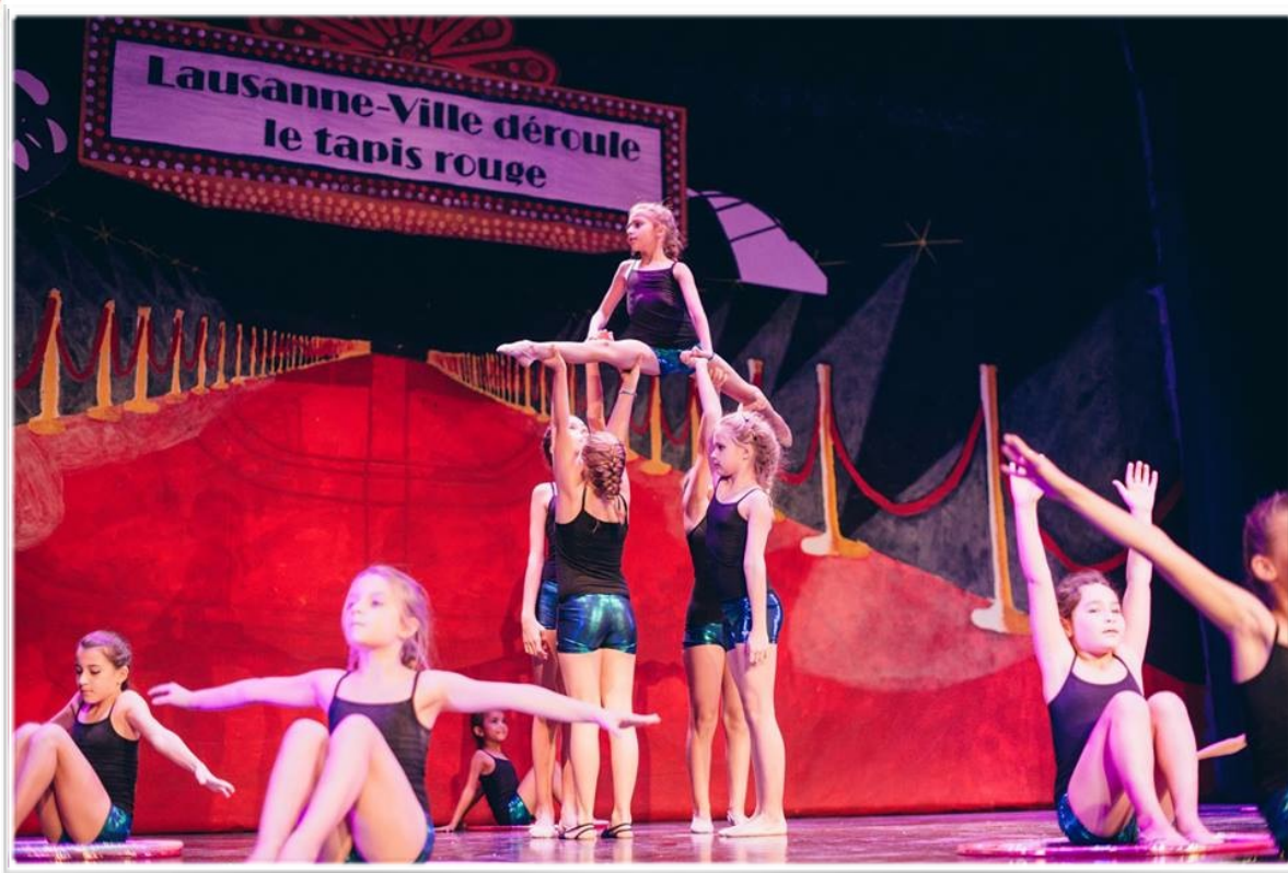
Les Gym Danse Petites, soirée annuelle 2017

Société de la Fédération Suisse de Gymnastique