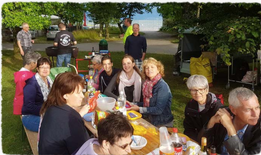
Grillade de fin de saison 2017

Société de la Fédération Suisse de Gymnastique