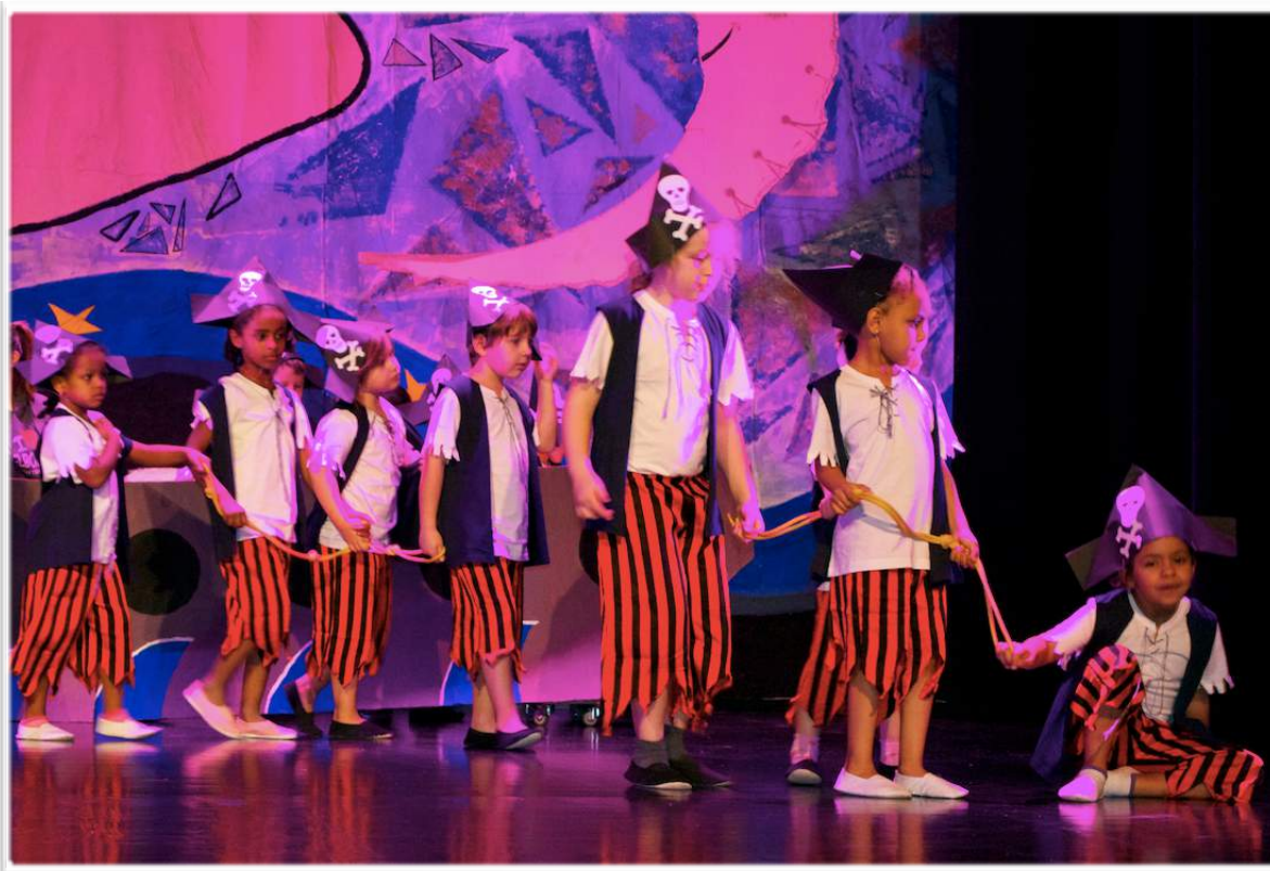
Les Enfantines, soirée de gym 2016

Société de la Fédération Suisse de Gymnastique