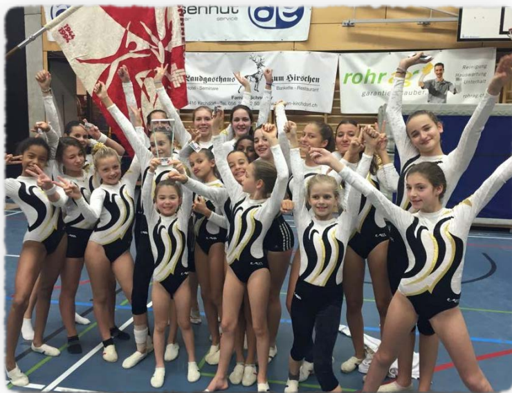
Les Agrès, championnes suisses 2015 au sol cat B.

Société de la Fédération Suisse de Gymnastique