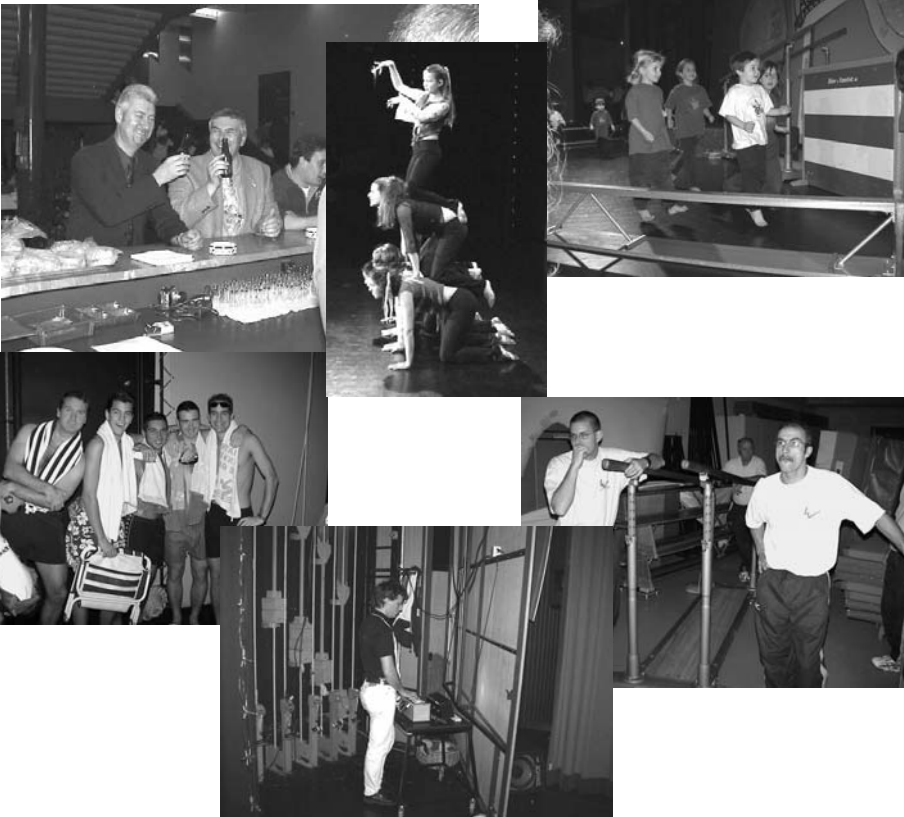
La soirée 2002 www.lausanne-ville.ch