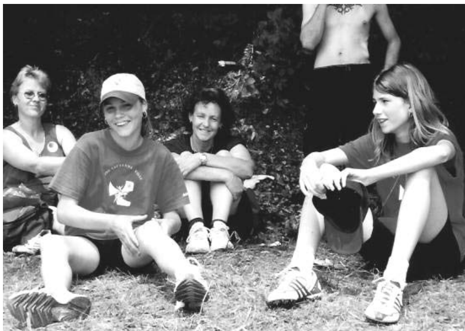
Quelques photos du team